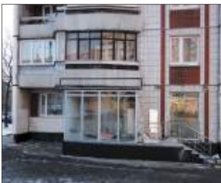
Входная группа в подвальные (цокольные или первые этажи зданий) в пределах земельного участка относящегося к общему имуществу.