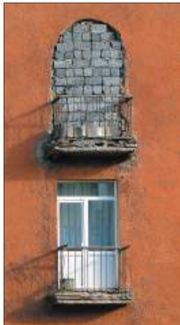
Проведение работ, затрагивающих внешний облик многоквартирных домов и жилых домов.