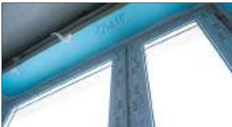
Замена окон без изменения оконного проема

Некоторые виды работ не требуют согласования в Мосжилинспекции, например: косметический ремонт и т.п.