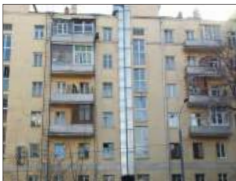
Устройство на фасаде многоквартирного дома вентиляционных коробов.