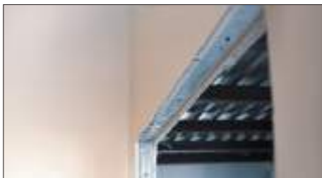
Заделка или устройство дверных проемов в несущих стенах.