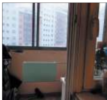
Перенос радиаторов отопления, подключенных к общедомовой системе, на лоджии, балконы и веранды.