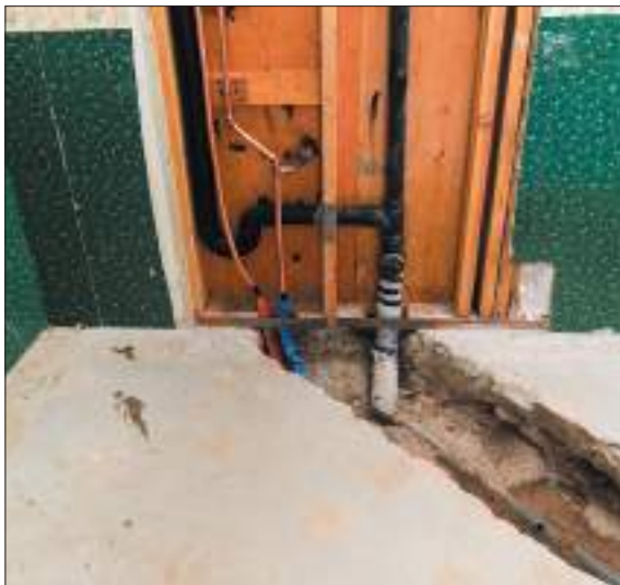
Устройство полов с подогревом от общедомовых систем горячего водоснабжения и (или) отопления.

С полным списком недопустимых работ можно ознакомиться в службе «одного окна» ИНПП по АО или в постановлении Правительства Москвы от 25.10.2011 №508-ПП.