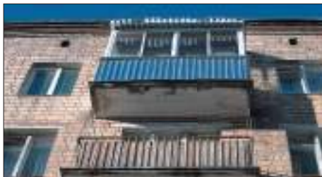
Остекление балконов, лоджий.

Все остальные работы, в целях обеспечения безопасности жизни, здоровья, имущества граждан и юридических лиц, государственного и муниципального имущества требуют оформления акта о завершеном переустройстве и (или) перепланировке, а также согласования проекта (если требуется).