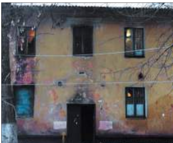
Мероприятия (работы) по переустройству и (или) перепланировке в домах, признанных в установленном порядке аварийными.