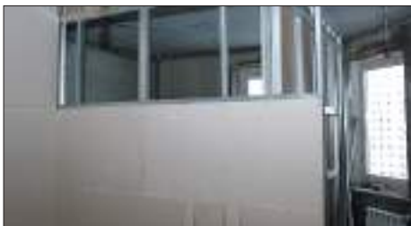
Монтаж и/или демонтаж несущих перегородок.

Например: объединение ванной с уборной без увеличения площади.